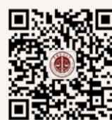
中国政法大学 微信公众平台