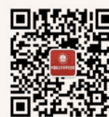
研究生院 微信公众平台