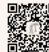
研究生迎新 微信公众平台