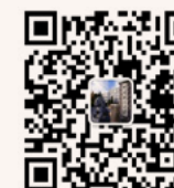
研招办 微信公众平台