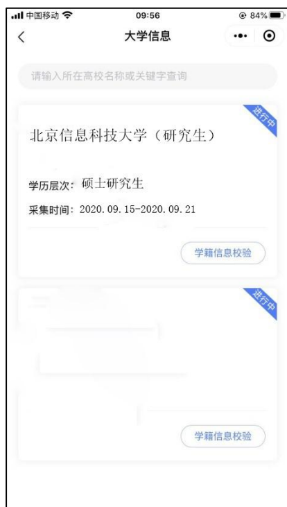
选择相应的学历层次