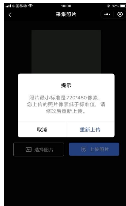
照片像素不符合标准