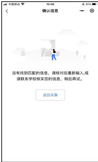
信息无法确认页面