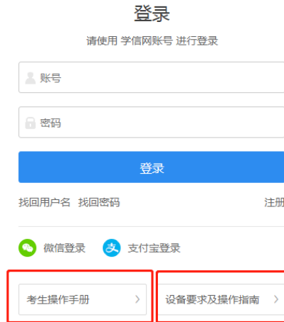
图 1 操作手册下载位置