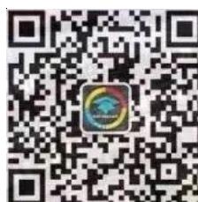
海大研究生微信二维码