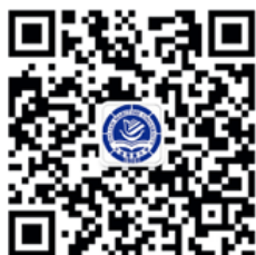
海大官方微信二维码