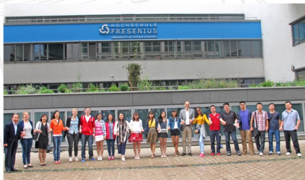
研究生赴德国欧福大学交流

学校着力构筑应用型高端人才国际化培养平台：与国内（境）外70多家高等院校和教育机构建立了合作伙伴关系，共同推进实施39个国际化教育项目，包括“广东财经大学海外实践教学平台”德国基地、新西兰基地和坦桑尼亚基地等。其中与澳大利亚西澳大利亚大学、伍伦贡大学等高校合作开展的1+1+1双硕士项目、与德国欧福大学联合培养的“数字化企业管理”1+1.5+0.5双硕士项目倍受瞩目。