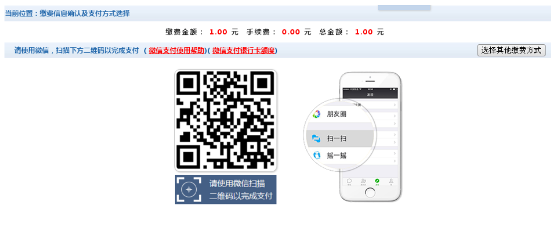
图 3.4-5 微信二维码支付界面

如图 3.4-4 所示，确定支付金额无误后，选择“微信支付”点击确定缴费，进入如图 3.4-5 所示微信二维码扫描支付界面。