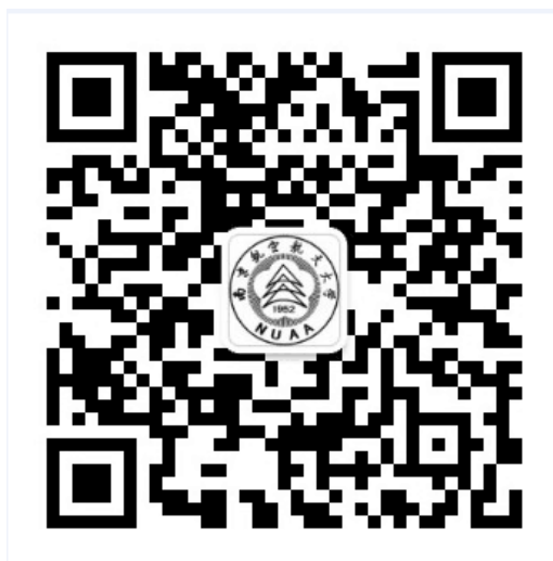
学校智慧校园门户登录缴费