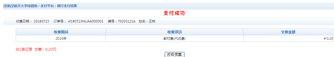
图 3.4-9 支付成功