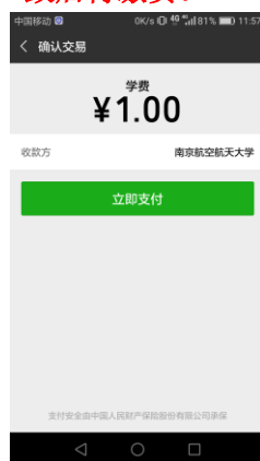
图 3.4-6 微信二维码扫码支付

微信支付，如图 3.4-5 所示，在手机打开微信，点击“扫一扫”，扫描缴费页面所示的二维码。进入微信支付界面，如图 3.4-6 所示。 注意：请确认收款方为 南京航空航天大学，金额与系统缴费金额一致后再缴费。