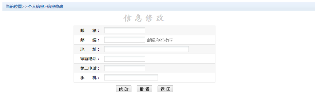
图 3.2.1-1 个人信息修改

点击个人信息界面的个人信息修改，显示 3.2.1-1 所示的个人信息维护界面。在相应的输入框，输入需要修改的个人信息，点击“修改按钮”完成个人信息维护。未保存前，点击“重置”按钮，还原个人信息。