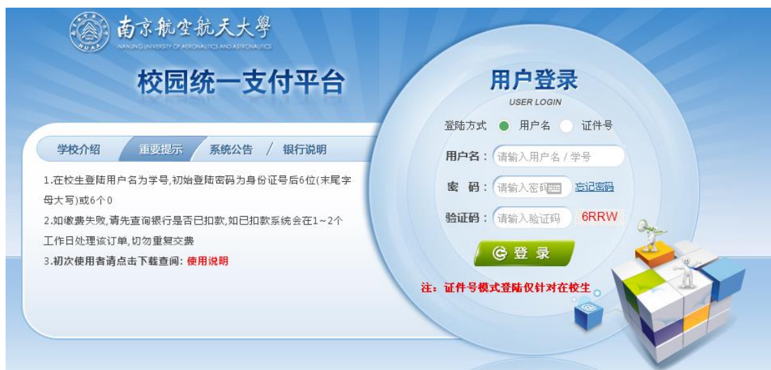
图 3.1-1 统一支付平台登陆界面

计算机登录：在浏览器地址栏输入 http://jiaofei.nuaa.edu.cn ，如图 3.1-1 所示。登陆之后显示个人欠费信息，如图 3.1-2 所示。