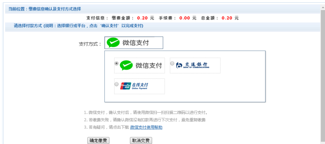
图 3.4-4 缴费方式选择