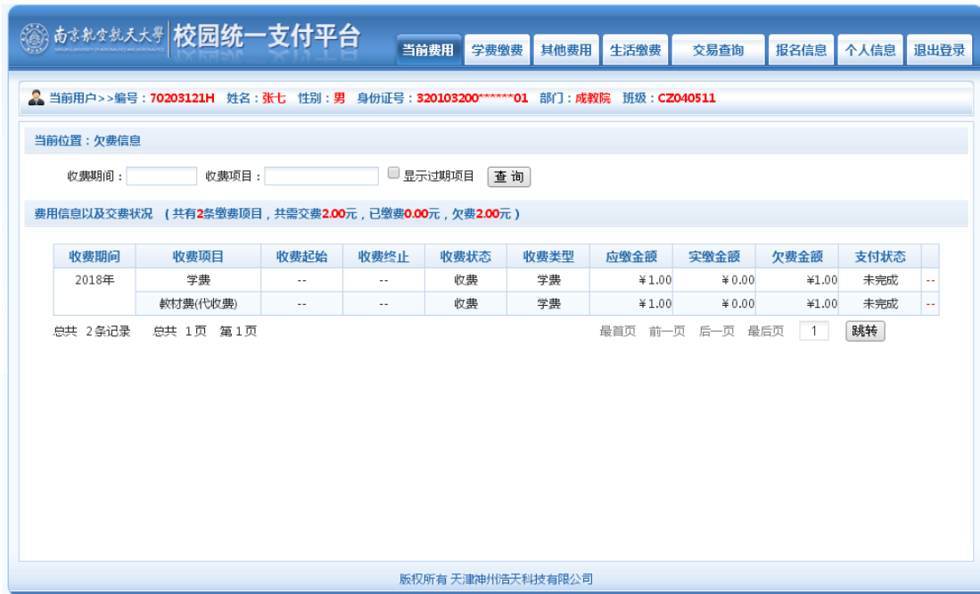
图 3.1-2 统一支付平台登陆后页面