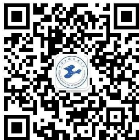
“上海工程技术大学研究生教育”