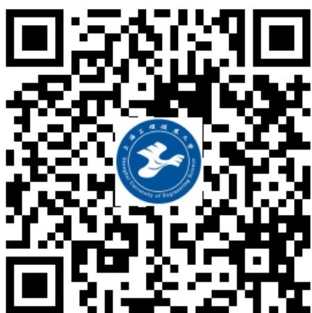
“上海工程技术大学研招网”